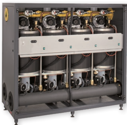
Obudowa kotła malowana na kolor szary